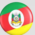
Rio Grande do Sul