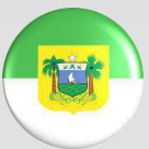
Rio Grande do Norte